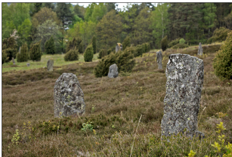
Figur 6. Några av de resta stenarna på Li-gravfältet, beläget intill bräckans norra del.

det välkända Li-gravfältet med cirka 125 bevarade resta stenar. Gravarna är endast sporadiskt undersökta men har gett dateringar till yngsta järnålder (Ångeby 2002).