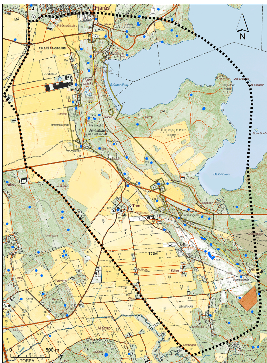
Figur 12. Kulturmiljövårdens riksintresse Fjärås Bräcka (N 10). Utredningsområdet markerat med rött.

Som framgått av redovisningen ovan återfinns det aktuella utredningsområdet i sydöstra delen av en för länet ovanligt innehållsrik och delvis välbevarad fornlämningmiljö. Fornlämningarna uppträder på och i direkt anknnytning till den geologiskt riksintressanta randbildningen Fjärås bräcka. Norra och mellersta delen av bräckan utgör därtill naturreservat, inom vilket omfattande landskapsvårdande insatser pågår sedan många år. Området är även utpekade som riksintresse för friluftslivet och utgör ett av länets största besöksmål.