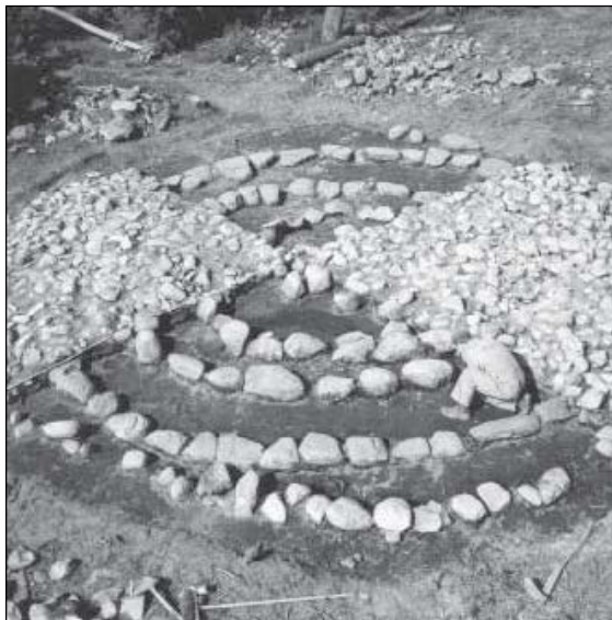
Figur 8. Cirkelbyggda stenkretsar i en av stensättningarna som undersöktes i den befintliga tälten på 1960-talet.

söktes och borttogs från mitten av 1900-talet och framåt ett ganska stort antal gravar. Några av dessa var belägna på bräckans krön, i skogskanten intill tälten på drönbilden i figur 7. På 1960-talet undersöktes ett gravfält med stensättningar – L1997:1502 m fl – i mellersta delen av den befintliga tälten. Gravarna var 8–20 meter stora och hade i flera fall spektakulära konstruktionsdetaljer (figur 8). De daterades till både äldre och yngre bronsålder samt romersk järnålder (Ängeby 2002).