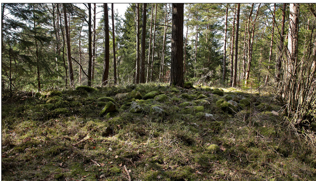
Figur 4. Stensättningen L1997:1499 söder om utredningsområdet.

Strax söder om utredningsområdet ligger stensättningen L1997:1499, 10 meter i diameter och 0,4 meter hög enligt beskrivningen i Fornsök. Graven är snarast 11 meter och 0,5 meter hög, välformad och fint placerad på en tydligt markerad höjdrygg. Även här rör det sig om ett topografiskt läge som möjliggjort vid exponering mot väster och nordväst.