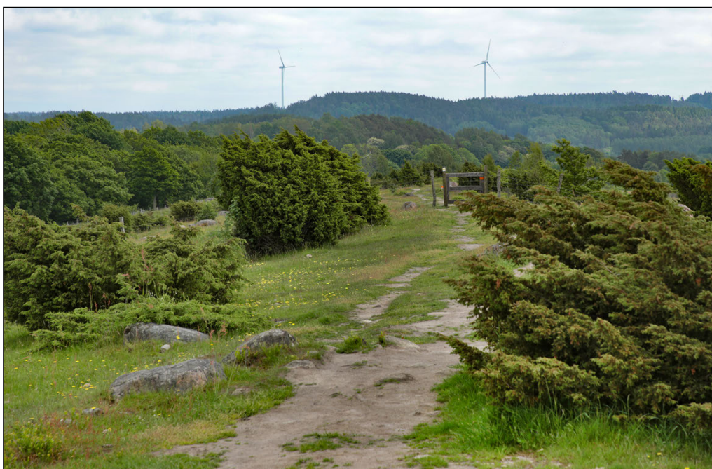
Figur 14. Bergformationen inom utredningsområdet (mellan vindkraftverken) är synlig från flera platser inom riksintresseområdet, som här vid Svalhögen i dess mellersta del.

Det höga berget markerar, som redan påtalats, bräckans slutpunkt. Den mäktiga israndbildningen upphör i praktiken vid bergets fot. Som framgår av fotot ovan är denna topografiska gräns mycket tydlig och synlig från många platser i omgivningarna, inom såväl som utom riksintresset, t ex från det höga partiet vid Svalhögen två och en halv kilometer mot nordväst (jfr figur 14). En exploatering av berget innebär således inte bara en ny typ av verksamhet (bergkross) som förändrar topografin på ett mer påtagligt sätt än tidigare. Det föreligger också en betydande risk att "sårbildningen" i landskapet, med en brant skärning, blir mer framträdande.