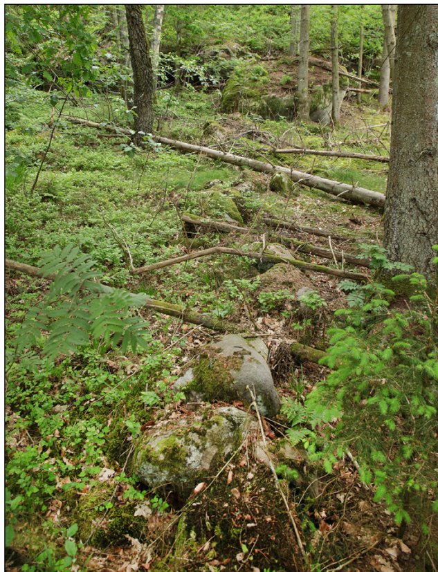
Figur 11. Blocksträng i nordvästra delen av utredningsområdet.

De enda synliga lämningarna inom utredningsområdet utgörs av en hålväg och en stenmur i fastighetsgränsen i sydväst samt en blocksträng i nordväst. Samtliga återfinns i lägre terräng. Den delen av hålvägen som löper inom utredningsområdet är uppemot två meter bred och ganska grund, 0,2–0,3 meter djup. Längre söderut smalnar den av. Den har sentida karaktär och anknyter inte till några av vägstråken på äldre kartor. Något ytterligare behov av dokumentation föreligger inte här.