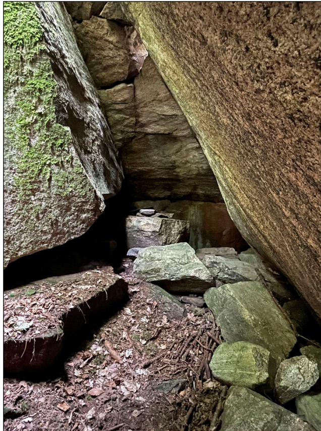
Figur 5. "Tjuvastugan" – grottbildningen 150 meter öster om utredningsområdet. Registrerad som L1997:1953 i Fornsök.

Cirka 150 meter öster om den utredda ytan ligger grottan "Tjuvastugan", registrerad som övrig kulturhistorisk lämning (L1997:1953). Grottan har bildats genom sprickbildning i den branta bergväggen och består av flera mycket stora block. Från nordost leder en smal passage in till ett sju meter långt "rum" med närmare fem meter i höjd. I den inre delen leder två passager vinkelrätt mot sidorna. Centralt i grottan finns ett block med plan överdel som enligt traditionen ska ha använts som bord av rövare. Traditionen pekar ut grottan som tillhåll för den senast avrättade personen i Kungsbacka.