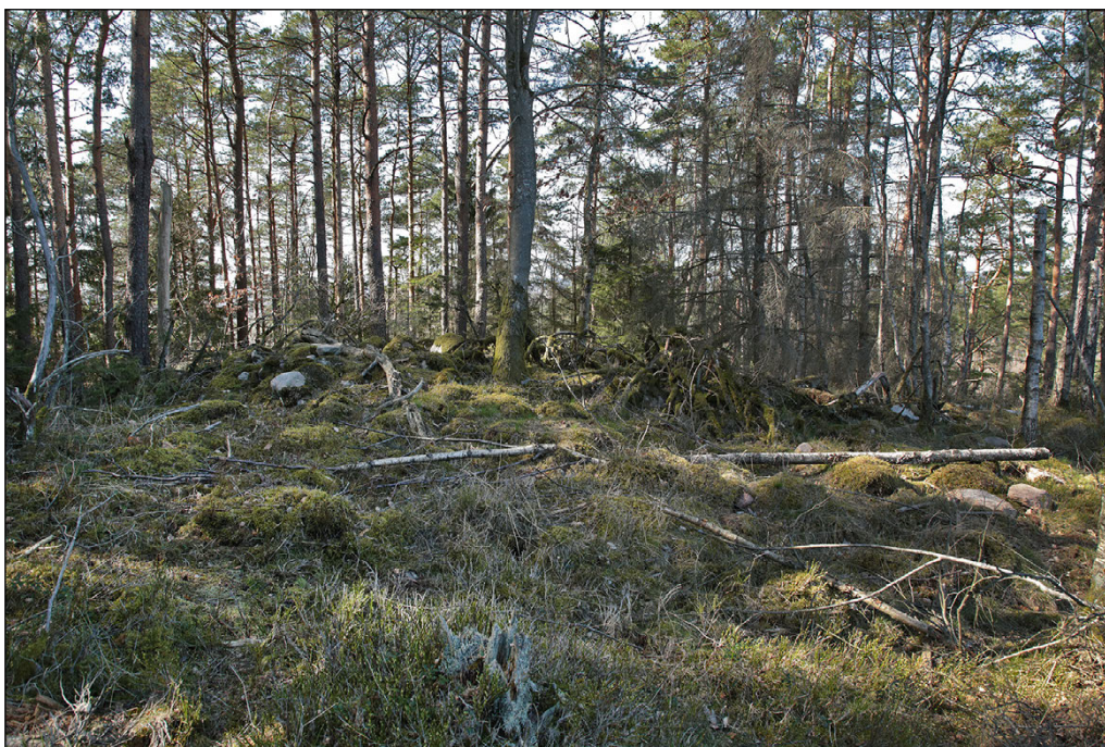
Figur 3. Gravröset L1997:2105 strax öster om utredningsområdet.

Strax söder om utredningsområdet ligger stensättningen L1997:1499, 10 meter i diameter och 0,4 meter hög enligt beskrivningen i Fornsök. Graven är snarast 11 meter och 0,5 meter hög, välformad och fint placerad på en tydligt markerad höjdrygg. Även här rör det sig om ett topografiskt läge som möjliggjort vid exponering mot väster och nordväst.