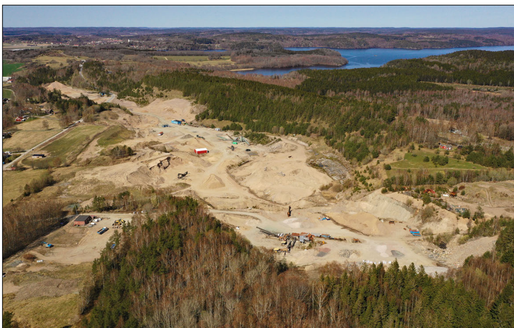
Figur 7. Drönbild över täkten nordväst om utredningsområdet. Inom täktområdet och längs dess östra sida har det tidigare funnits flera gravar. I mellersta delen av bilden undersöktes 1998 en stor förhistorisk boplats.

Från Limmahögarna och vidare mot sydost, bl a inom den befintliga täkten, under-