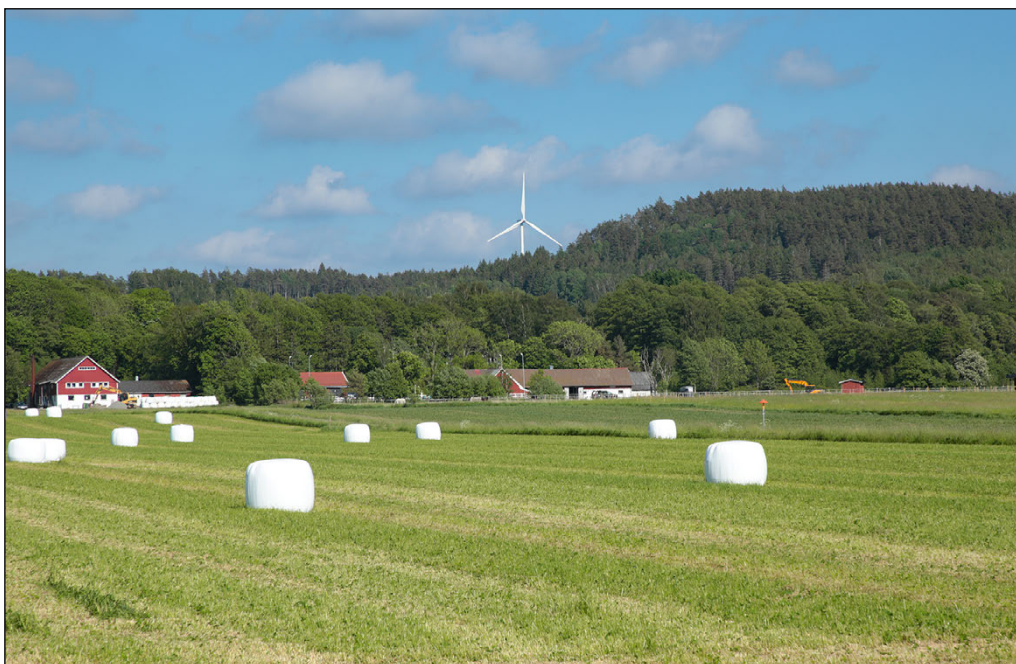
Figur 13. Den planerade bergtåkten kommer att sträcka sig in i bergshöjden till höger i bild.

Det höga berget markerar, som redan påtalats, bräckans slutpunkt. Den mäktiga israndbildningen upphör i praktiken vid bergets fot. Som framgår av fotot ovan är denna topografiska gräns mycket tydlig och synlig från många platser i omgivningarna, inom såväl som utom riksintresset, t ex från det höga partiet vid Svalhögen två och en halv kilometer mot nordväst (jfr figur 14). En exploatering av berget innebär således inte bara en ny typ av verksamhet (bergkross) som förändrar topografin på ett mer påtagligt sätt än tidigare. Det föreligger också en betydande risk att "sårbildningen" i landskapet, med en brant skärning, blir mer framträdande.