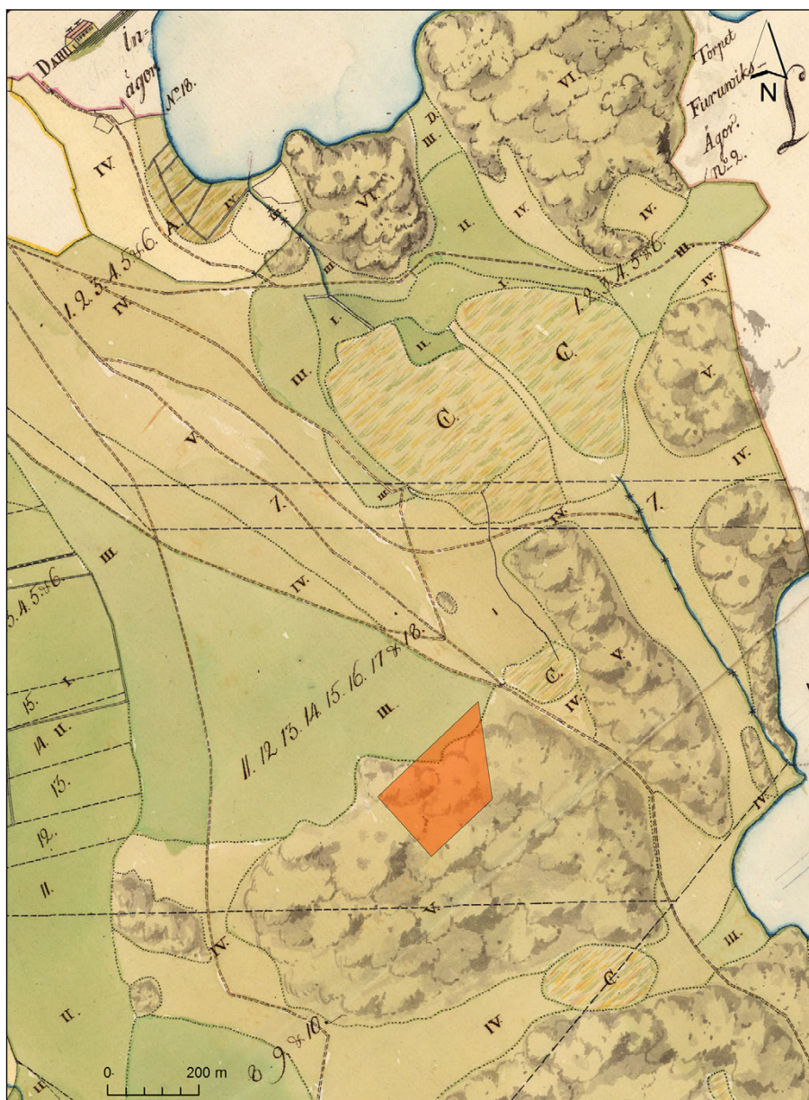
Figur 9. Utsnitt ur 1781 års karta över utmarksområdet "Sörmarken", med utredningsområdet markerat (rött). Akten M13-11:1 i Lantmäteristyrelsens arkiv, Riksarkivet.

Som framgår av kartbilden ligger utredningsområdet på en yta som på 1700-talet utgjordes av öppen, bergig terräng. Den aktuella marktypen karakteriseras i beskrivningen till 1781 års karta som " Bergaktig mark med något Ene och Ljung bewäxte ". Det rör sig här om ett mycket öppet landskap – klassisk halländsk utmark.