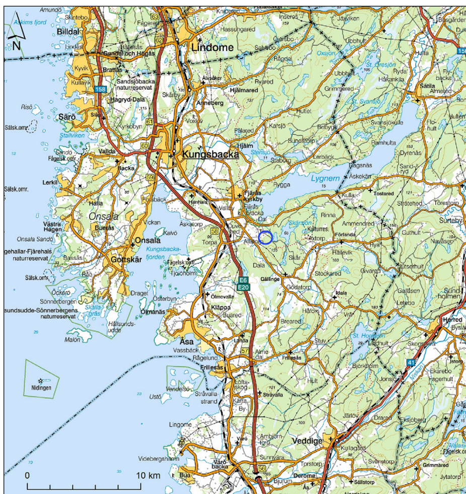
Figur 1. Undersökningsområdets läge. Underlagskarta: Översiktskartan.

Utredningsområdet ligger delvis på och i direkt anslutning till den mäktiga israndbildningen Fjärås bräcka. Den här delen av bräckan är, och har tidigare i ännu högre grad varit, mycket fornlämningsrik. I omedelbar anslutning till det utredda området finns två registrerade förhistoriska gravar (figur 2). Mot denna bakgrund och det faktum att det även rör sig om riksintresse för kulturmiljövården har Länsstyrelsen beslutat om arkeologisk utredning (dnr 431-8576-2020).