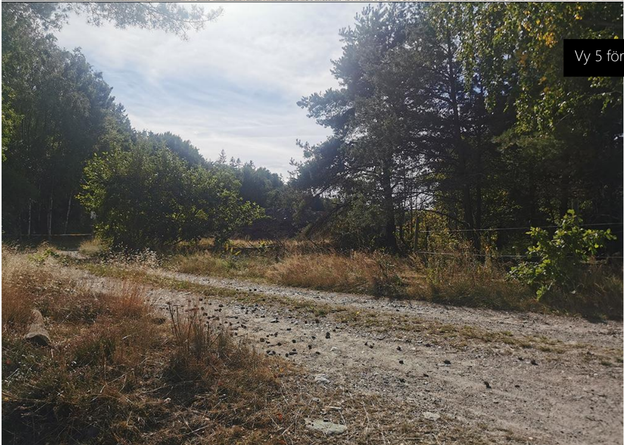
Vy 5 före