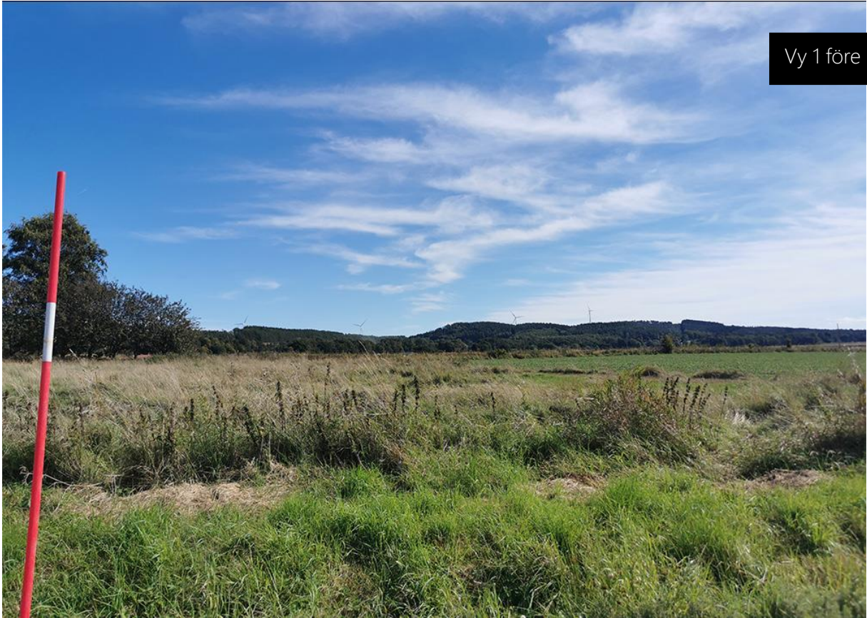
Vy 1 före