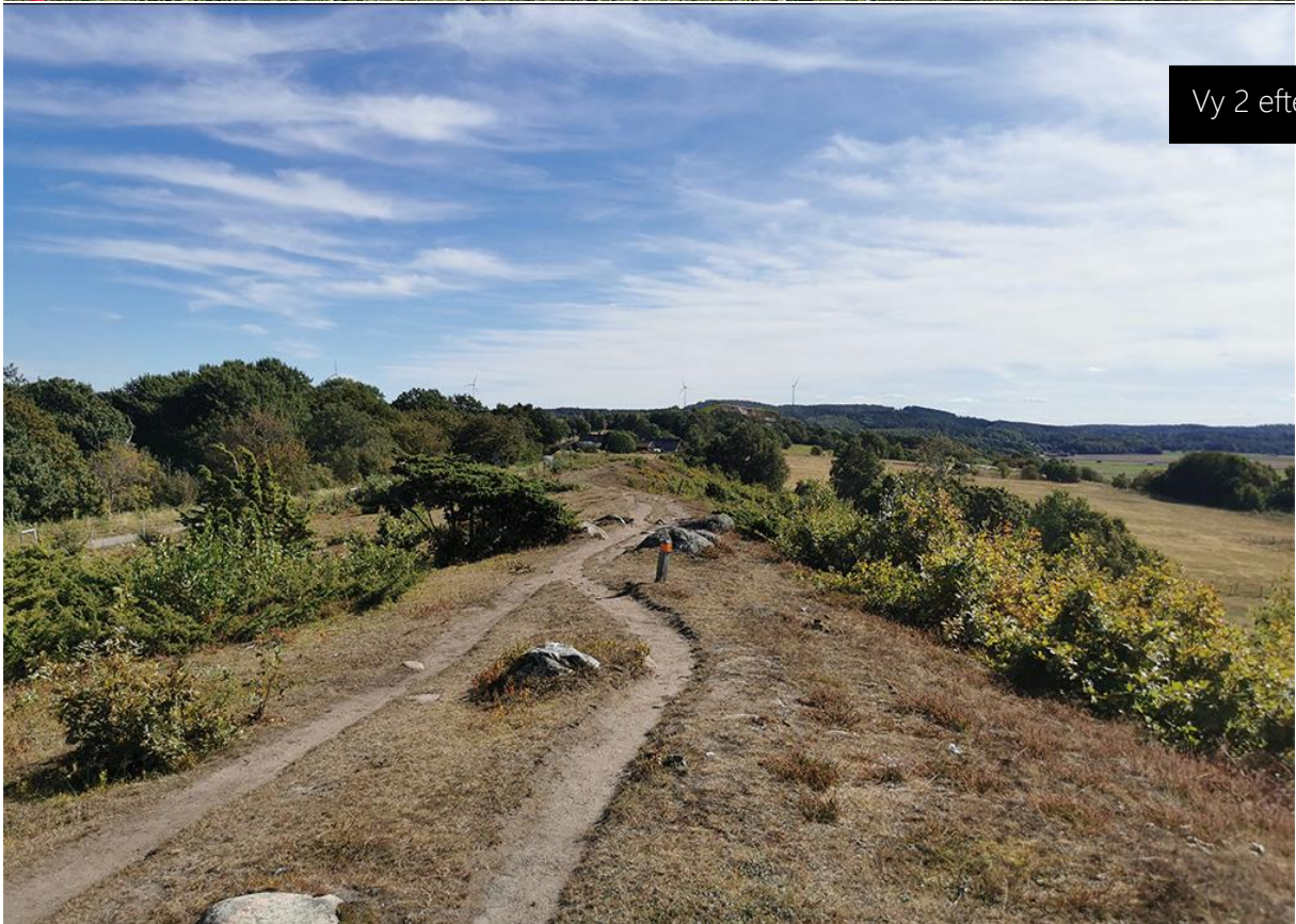
Vy 2 efter