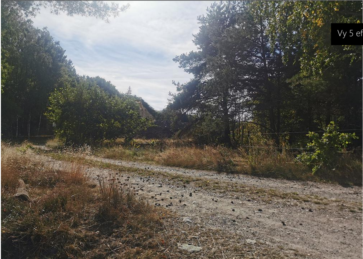
Vy 5 efter